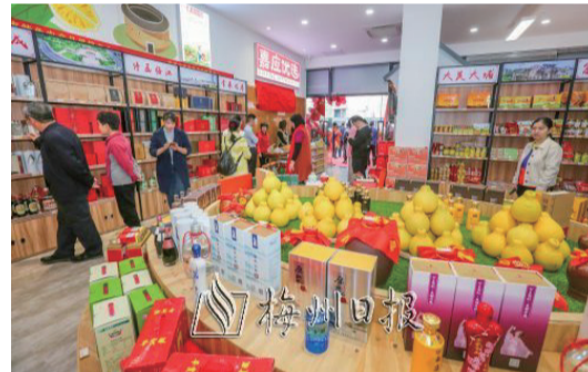
梅州市特色農產品展銷中心一角。

此次活動由梅州日報社、市農業農村局主辦,梅州市特色農產品產業發展中心、梅州日報貿易發展有限公司、廣東嘉吉健康生物科技有限公司承辦。